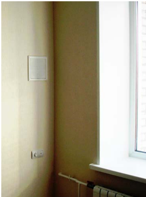
Рис. 4. Размещение в квартире

лучше «дышит» квартира, оборудованная парой таких приборов. Размещенные в разных концах квартиры (рис.2) приборы автоматически «договариваются» между собой и работают синхронно: когда один делает вдох, второй – выдыхает, и наоборот. Именно благодаря этому пара местных вентиляционных приборов без воздуховодов работает практически как традиционная система с разнесенным притоком и вытяжкой, гарантированно проветривая всю квартиру.