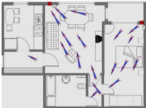
Рис.2 Схема размещения приборов в квартире

Упомянутые приборы являются оборудованием местной вентиляции и вентилируют только зону вблизи себя, в лучшем случае одну комнату.