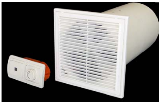
Рис. 1. Прибор УВРК-50

Применение в строительстве герметичных окон значительно улучшило комфорт современного жилища, но одновременно нарушило схему его вентиляции: она предусматривала поступление свежего воздуха через щели в окнах. Результат – высокая влажность в помещении, накопление аллергенов, плесень, грибок. Большинство технических решений, призванных исключить это явление, лишь попытка в том или ином виде реанимировать умирающую схему вентиляции. Замена щели в окне на различные клапаны, проветриватели итп ничего не меняет по сути. Потребитель, заплатив деньги,