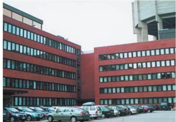
Рисунок 2. Здание «EKONO-house» (Отаниеми, Финляндия)