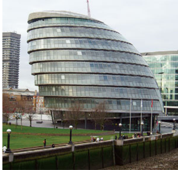
Рисунок 5. Здание мэрии в Лондоне (Великобритания)

В мировой практике в развитых странах строительство энергоэффективных зданий является обязательным требованием, предъявляемым к каждому проектируемому зданию. Более того, в последние годы широкое распространение получает практика оценки (сертификации) проектов зданий по эффективности использования энергии, снижению негативного влияния на окружающую природную среду и повышению качества среды обитания человека, например, сертификат LEED (Leadership in Energy and Environmental Design Building). Проект здания, получивший «платиновый», «золотой» или «серебряный» сертификат LEED, как правило, получает налоговые льготы и гранты. Очевидно, что здание, имеющее соответствующий сертификат LEED, более привлекательно для арендаторов и стоит дороже при продаже потребителю.