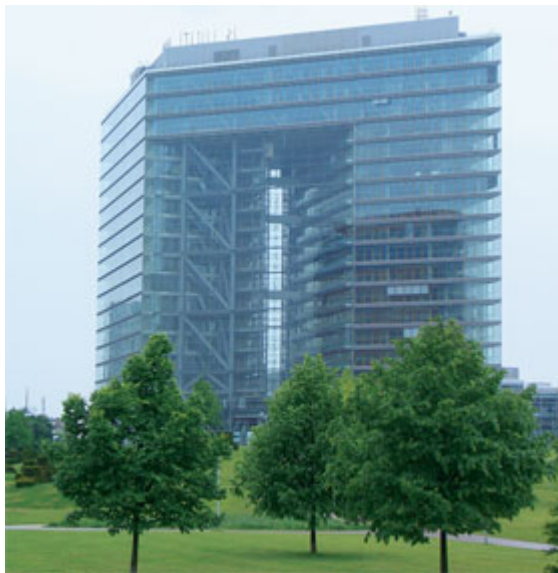
Рисунок 3. Здание «Ворота Дюссельдорфа» (Германия)