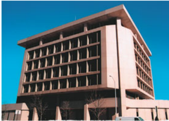
Рисунок 1. Федеральное офисное здание (Манчестер, США)