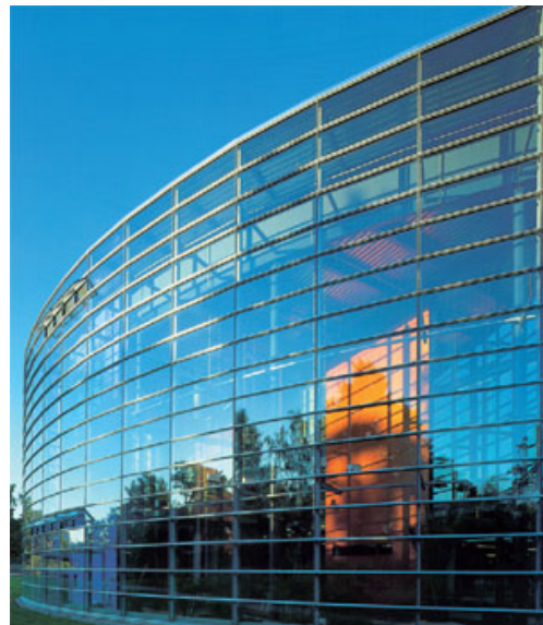
Рисунок 4. Информационный центр «KORONA» в Хельсинки (Финляндия)