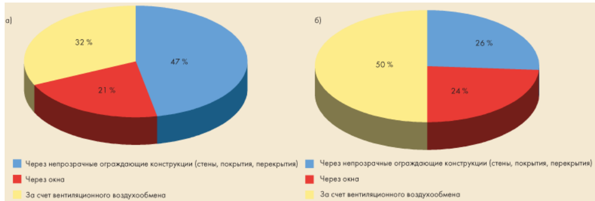
Рисунок 7 Структура потерь энергии в жилых многоэтажных зданиях массовой застройки:

Рассмотрим, как изменилась за последние 35 лет структура расхода энергии, затрачиваемой на обеспечение микроклимата помещения в жилых зданиях массовой застройки. На рис. 7 приведены диаграммы теплотерь жилых многоэтажных зданий, построенных до 1995 года, и жилых зданий, построенных после принятия известных Постановлений Госстроя РФ о необходимости повышения теплозащитных показателей наружных ограждающих конструкций.