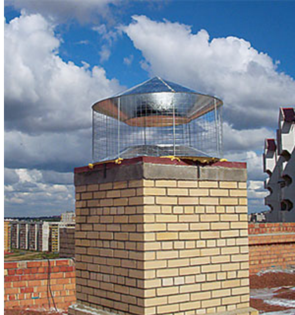
Рисунок 8. Гибридная вентиляция

Однако, это скромный перечень инновационных решений, которые могут быть применены преимущественно во вновь строящихся зданиях. (А вот это к нашим приборам отношения не имеет. Компактные, незаметные децентрализованные они пригодны и для новой многоэтажки и для одной комнаты в старой хрущевке. Отверстие в стене, 1-2 часовой монтаж – и в вашей комнате теплый свежий воздух) Но количество таких зданий составляет тысячные доли процента по отношению к существующим зданиям. В результате проблема качества микроклимата в существующих зданиях оставляет серьезные причины для беспокойства. (Надеемся, что наши вентиляционные приборы станут лекарством от такой озабоченности)